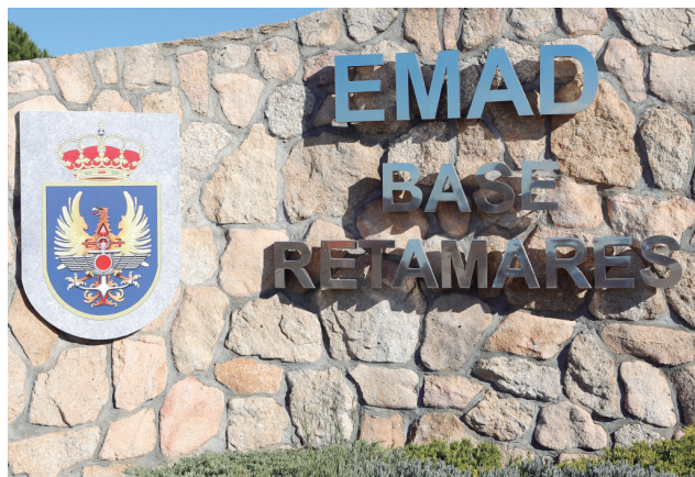
Un rótulo y el escudo del EMAD, situados en la entrada, recuerdan el actual empleo de la base de Retamares.

La OTAN decidió excluir a este Cuartel General de su estructura de mando en junio de 2011, después de que en su cumbre de noviembre de 2010 en Lisboa se aprobara un nuevo concepto estratégico que pasaba por una reducción de personal, instalaciones y agencias. A cambio se otorgó a España uno de los Centros de Operaciones Aéreas Combinadas (CAOC), que ya está en funcionamiento en To-