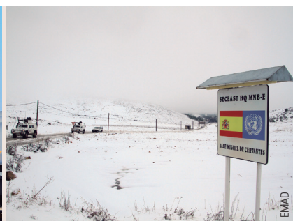
De izquierda a derecha, crucero, hoy fuera de servicio, que llevó el nombre del autor del Quijote ; los aviones y el emblema del Ala 14 (Albacete) llevan por el mundo a don Alonso y Sancho; y la base Miguel de Cervantes, en Líbano.