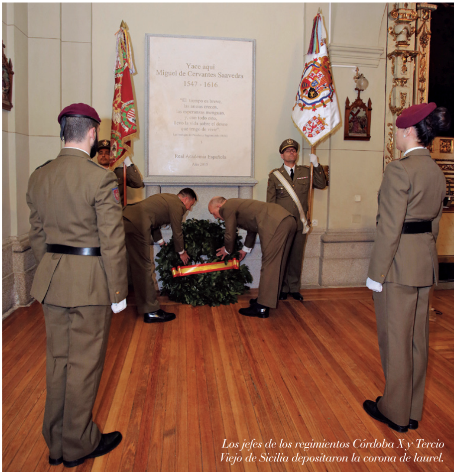
Los jefes de los regimientos Córdoba X y Tercio Viejo de Sicilia depositaron la corona de laurel.