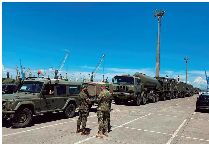
El proyecto de Movilidad Militar —en la foto, efectivos españoles en un ejercicio en Rumanía— beneficiará a la UE y la OTAN.

Semanas más tarde, el día 28, durante un encuentro informal en Lisboa —realizado de manera presencial y bajo la presidencia del Alto Representante para Asuntos Exteriores y Política de Seguridad Común, Josep Borrell— los responsables de Defensa debatieron diversas cuestiones de actualidad relativas a Libia, Malí y Mozambique y continuaron analizando diferentes as-